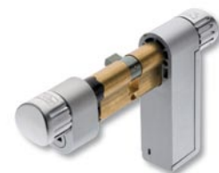
TSE 3005 Twinlock

Ausführung Halbzylinder: Für Anwendungen innerhalb von Gebäuden, nicht für Räume ohne Notausgang geeignet. Für Garagentore ungeeignet. Ohne Notschloss. Inkl. 1 TSE E-Key.