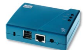
TSE Netzwerk Unit