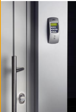
TSE 3004 Wireless

TSE Wireless hinterlässt beim Wohnungswechsel keine Spuren.