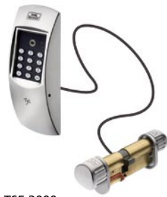
TSE 3000 Basic MCR