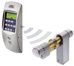
TSE 3004 Wireless