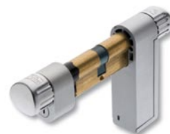
TSE 3005 Antipanic

Ausführung Twinlock: mit beidseitigem Freilauf. Inkl. 1 TSE E-Key. Nicht für Räume ohne Notausgang geeignet. Bei Bedarf mit 2 Codetastaturen zu ergänzen.