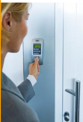
TSE 3004 Fingerscan