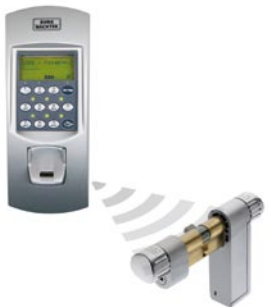
TSE 3004 Fingerscan