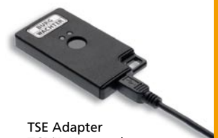
TSE Adapter TCP/IP Netzwerk