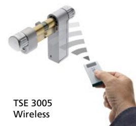
TSE 3005 Wireless

Ausführung Antipanic: für spezielle Antipanic-Schlösser in Fluchttüren, inkl. 1 TSE E-Key.