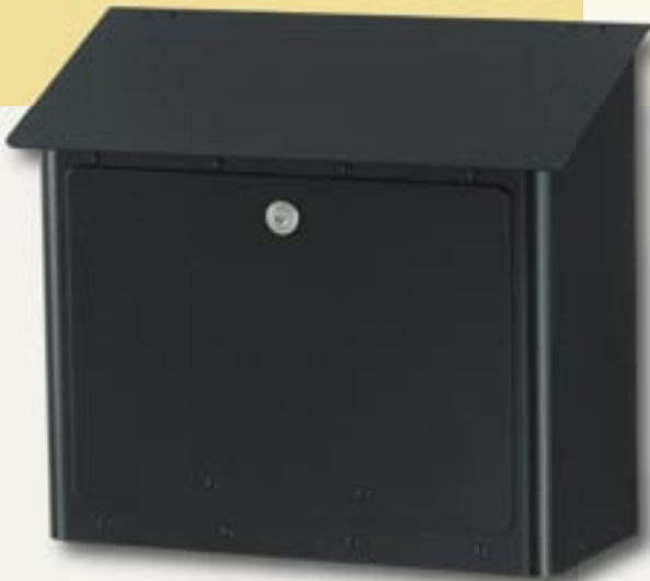
GRAN-SECURO 05 64381-040 diamantsilber