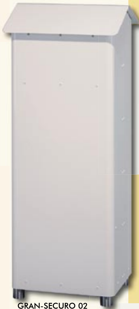
GRAN-SECURO 02 64378-034 weiß