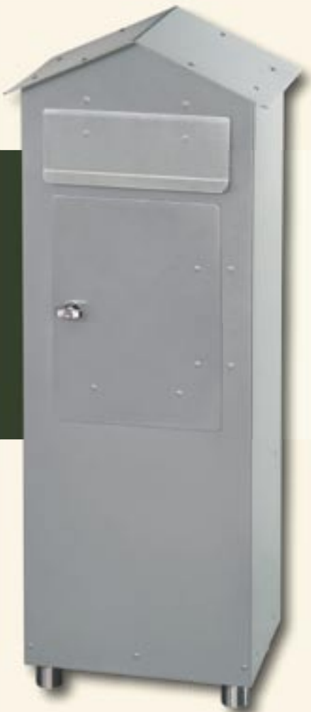
GRAN-SECURO 01 64377-040 diamantsilber