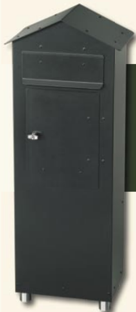
GRAN-SECURO 01 64377-028 glimmer

Postkasten "GRAN-SECURO 01", freistehend, zum Andübeln, in schwerer, massiver Ausführung, aus feuerverzinktem Stahlblech mit Edelstahl- Füßen (inkl. Schrauben 8x120 mm), hochwertiger Pulverlack, extra geräumiges Staufach mit verstellbarem Boden, großer Einwurfschlitz, Drehverschluss (auch ohne Schlüssel bedienbar)