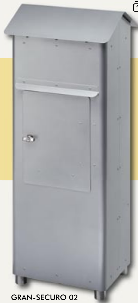
GRAN-SECURO 02 64378-040 diamantsilber