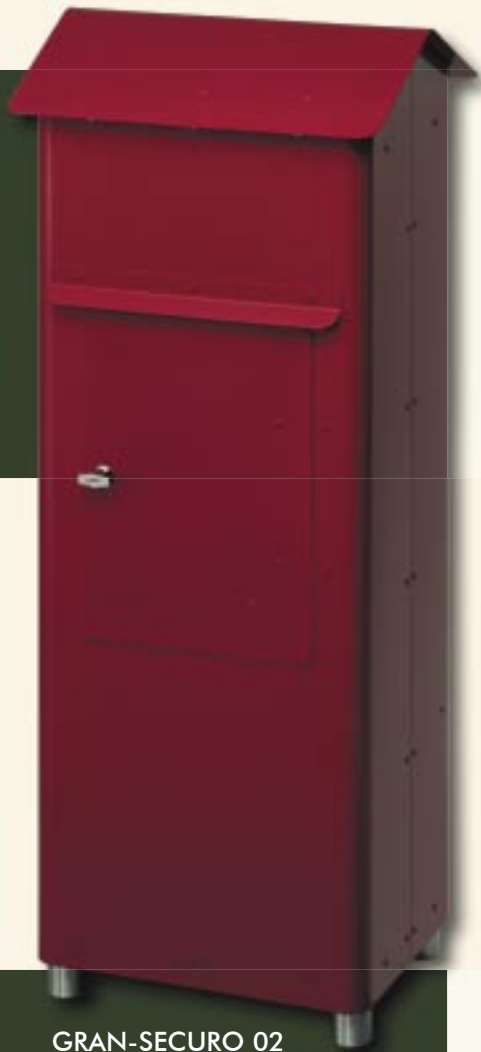
GRAN-SECURO 02 64378-038 rot