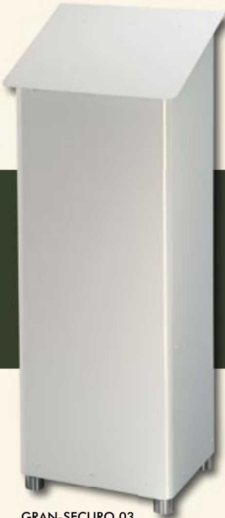
GRAN-SECURO 03 64379-034 weiß