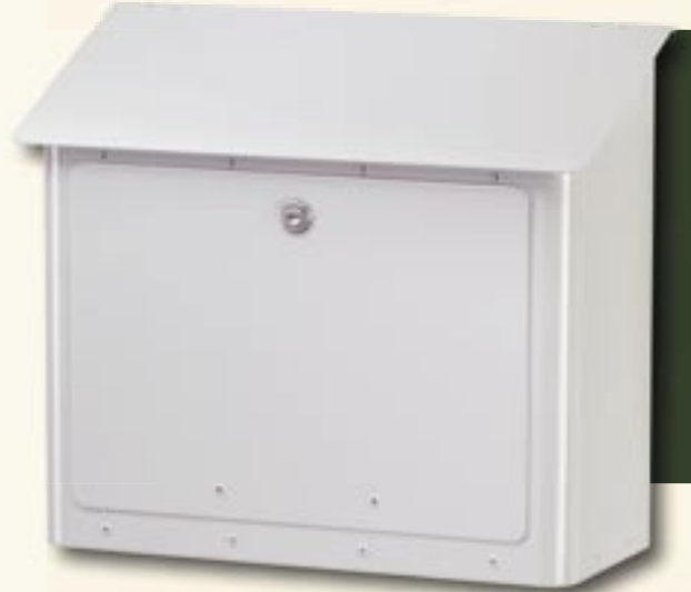
GRAN-SECURO 05 64381-028 glimmer