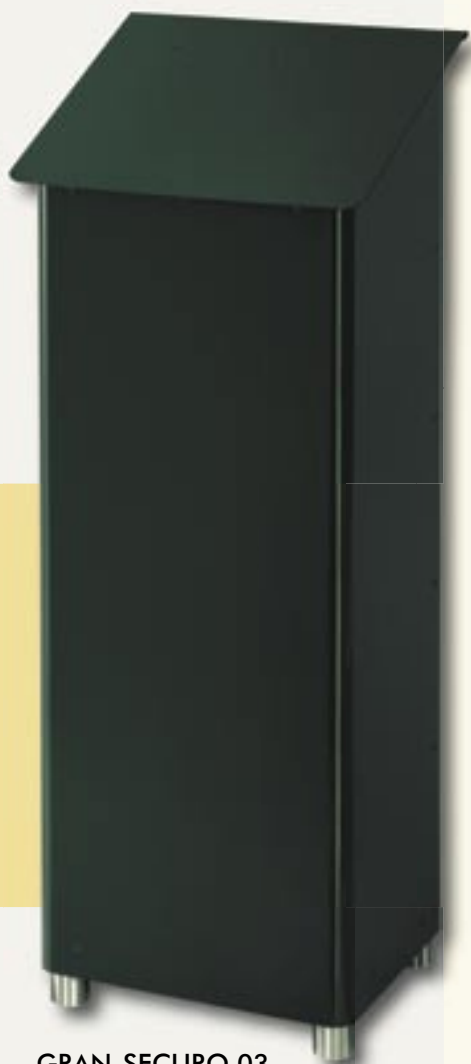
GRAN-SECURO 03 64379-015 dunkelgrün

Postkasten "GRAN-SECURO 03", freistehend, in schwerer, massiver Ausführung, zum Andübeln, aus feuerverzinktem Stahlblech mit Edelstahl-Füßen (inkl. Schrauben 8x120 mm), hochwertiger Pulverlack, extra geräumiges Staufach mit verstellbarem Boden, großer Einwurfschlitz kann in 3 Stufen verstellt werden (groß 69 mm, mittel 52 mm, klein 35 mm), Drehschloss (auch ohne Schlüssel bedienbar),