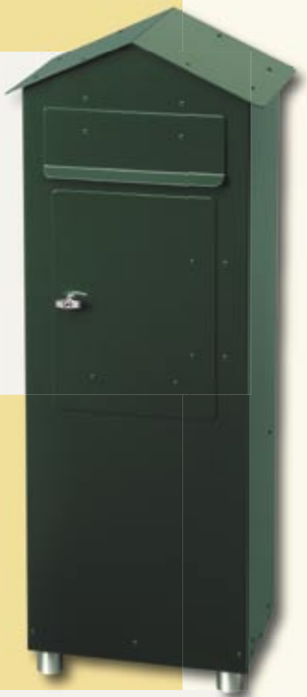
GRAN-SECURO 01 64377-015 dunkelgrün