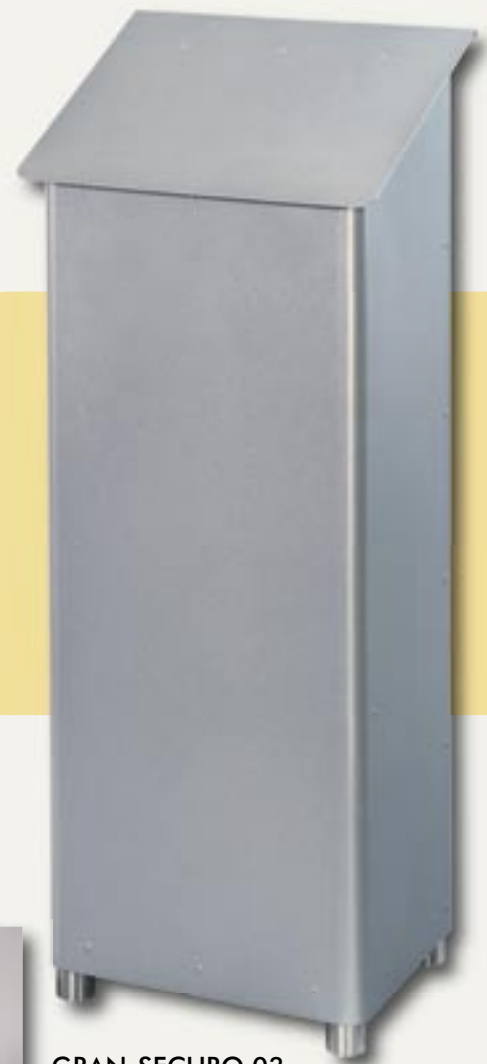
GRAN-SECURO 03 64379-040 diamantsilber