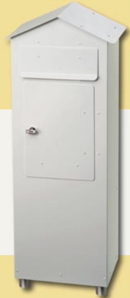
GRAN-SECURO 01 64377-034 weiß