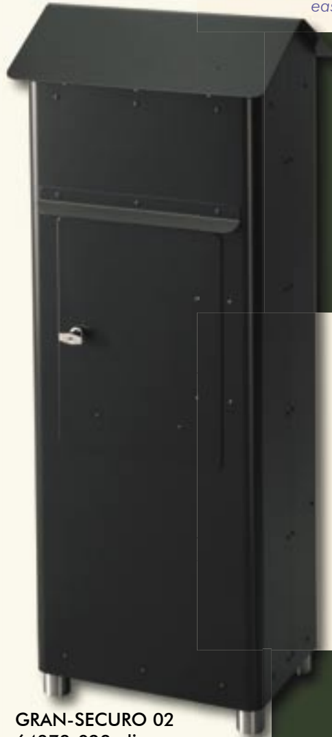
GRAN-SECURO 02 64378-028 glimmer