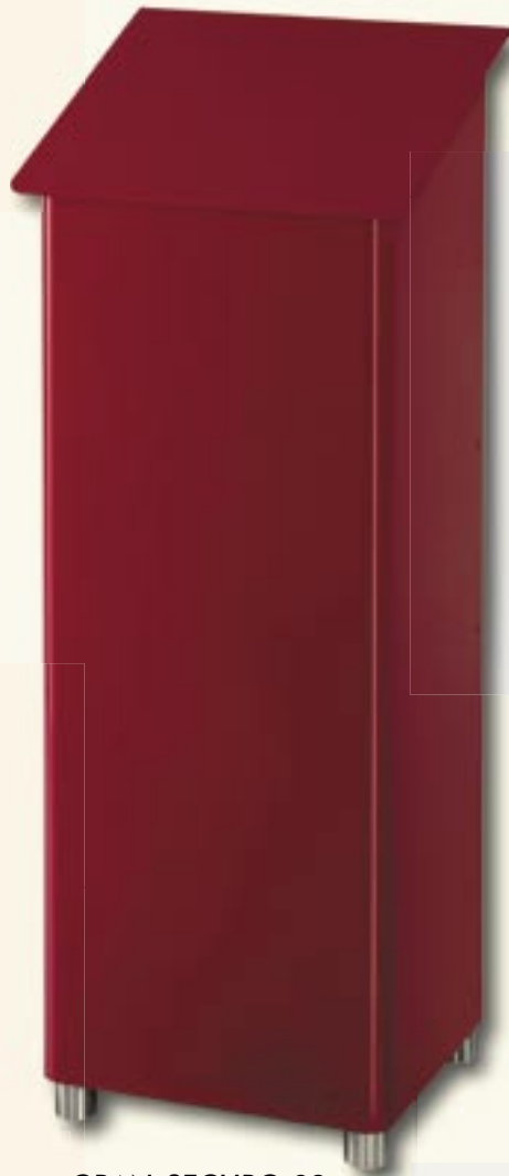
GRAN-SECURO 03 64379-038 rot