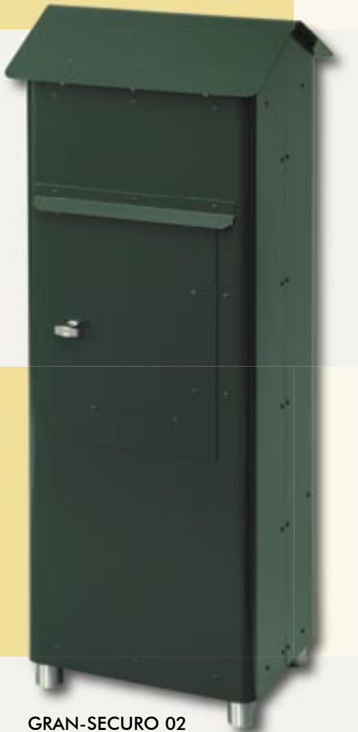
GRAN-SECURO 02 64378-015 dunkelgrün

The slot of 'GRAN-SECURO 02' is placed under the protecting roof. No rain or humidity can enter. It depends on your decision in which direction the roof can be opened. Its construction permits easy variation of access.