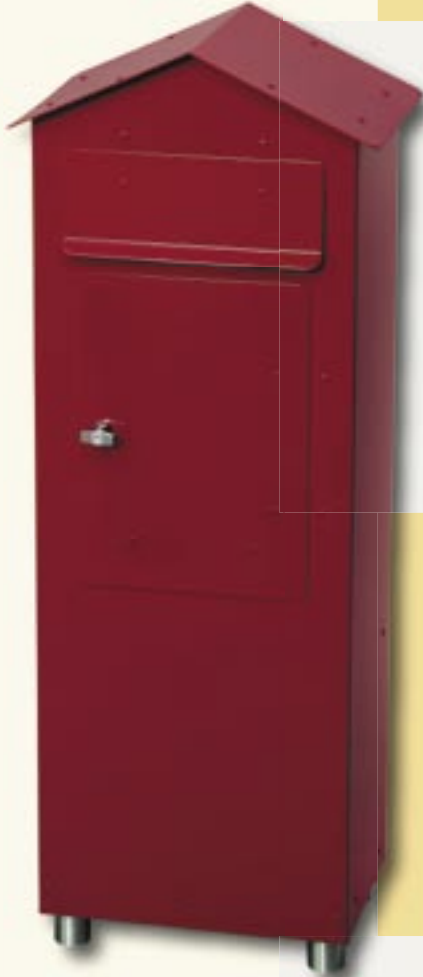
GRAN-SECURO 01 64377-038 rot