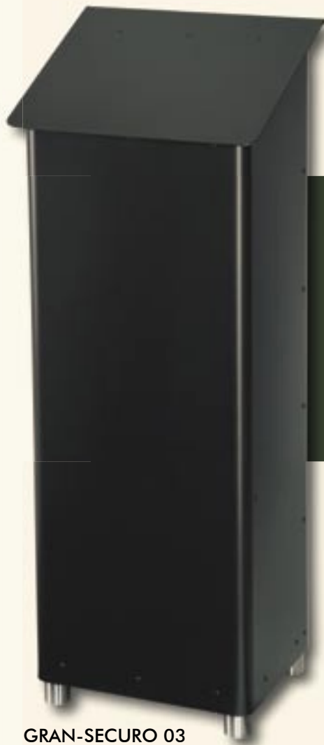
GRAN-SECURO 03 64379-028 glimmer

80180 Halteblech zum Einbetonieren, feuerverzinkt, 27x36 cm Montage siehe Seite 28